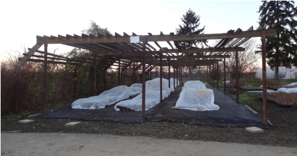
FOTOGRAFIE - STÁVAJÍCÍ STAV:

VEŠKERÉ PRÁCE PROVÁDĚT DLE PLATNÝCH ČSN A TECHNOLOGICKÝCH PRAVIDEL ZA DODRŽENÍ PRAVIDEL BEZPEČNOSTI PRÁCE A OCHRANY ZDRAVÍ PŘI PRÁCI. POKUD DOJDE PŘI PROVÁDĚNÍ PRACÍ K NEJASNOSTEM, ČI NEPŘEDVÍDATELNÝM OKOLNOSTEM, JE NUTNÉ PŘIZVAT PROJEKTANTA K POSOUZENÍ, RESP. UPŘESNĚNÍ POSTUPU PRACÍ. PŘI PROVÁDĚNÍ PRACÍ JE NUTNÉ ZOHLEDNIT STAVEBNÍ ÚPRAVY PROFESÍ. PŮVODNÍ SKLADBY A ROZMĚRY KONSTUKCÍ JSOU PŘEVZATY Z PROJEKTU STAVBY.